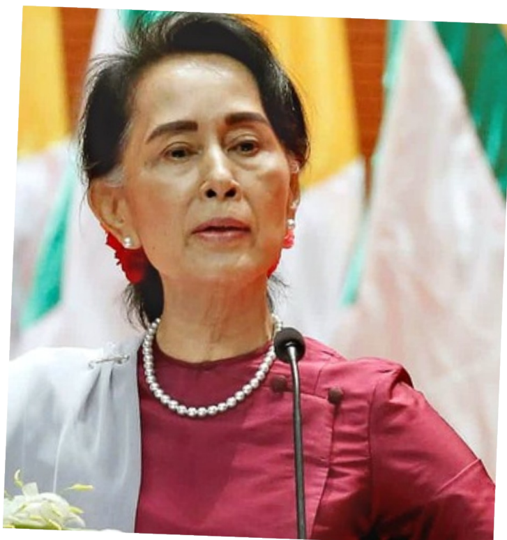
Billedet viser Aung Suu Kyi.

Dzongsar Khyentse Rinpotje tager Aung Suu Kyi i forsvar og angriber 'Vesten' for fortsat forsøg på kolonialisme og kulturel imperialisme, som han opfatter det. Læs hans brev til Aung