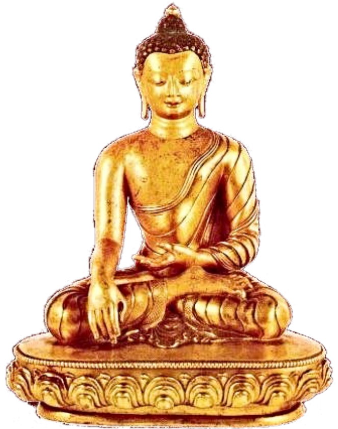
Buddha Sakyamuni's Nirvana