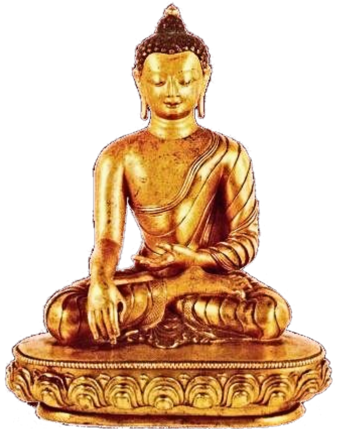
Buddha Sakyamuni's Nirvana